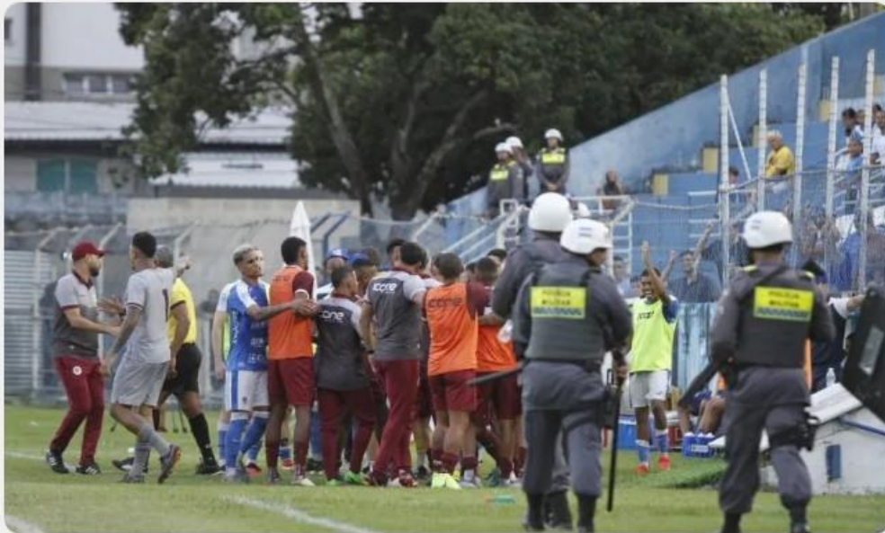
Polícia precisou intervir durante a partida