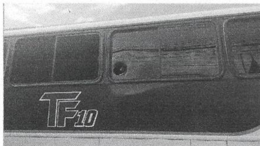
Ônibus do Capixaba é apedrejado