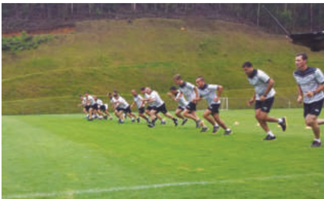
Preparação física da arbitragem.