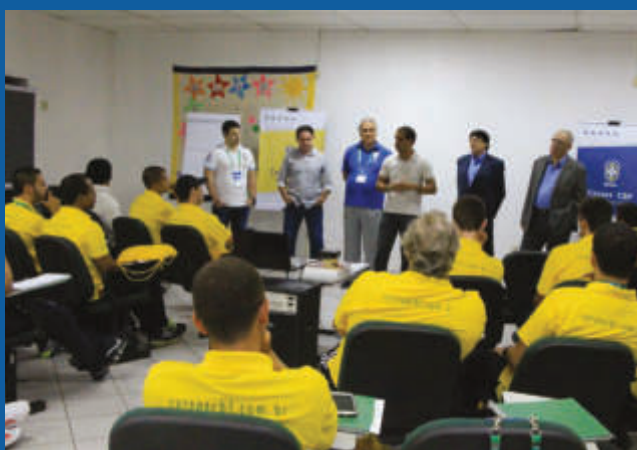
Curso de preparadores físicos.

- Realizado antes dos campeonatos para esclarecer eventuais dúvidas sobre os regulamentos das competições, procedimentos referentes a registros e controle de inscrição de atletas.