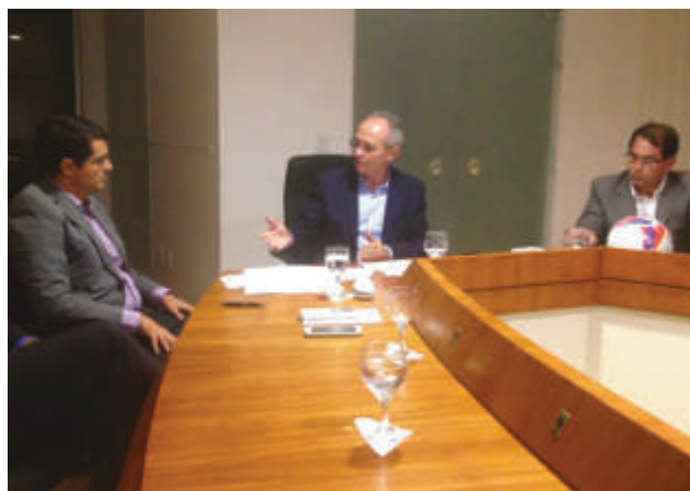
Primeira audiência com o Governador Paulo Hartung.