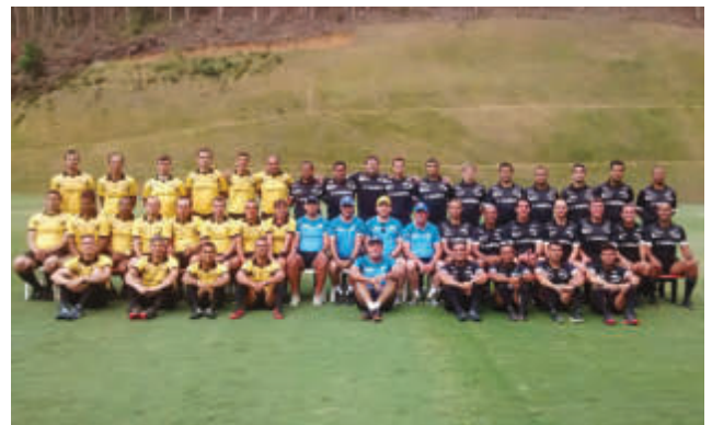
X Pré-temporada da arbitragem, no China Park, em Domingos Martins.