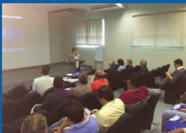
Reunião com clubes sobre o PROFUT.