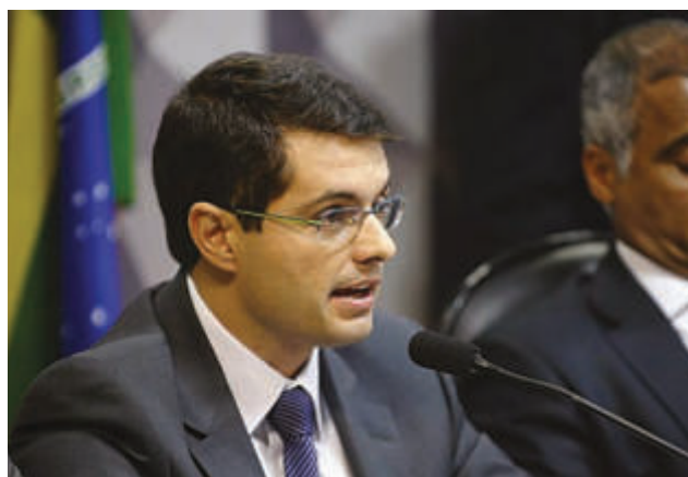
Presidente da FES faz apelo pelos clubes capixabas no senado.