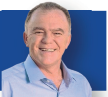
RENATO CASAGRANDE, GOVERNADOR DO ESPÍRITO SANTO.

"Os investimentos que o Estado tem feito no futebol capixaba, por meio do Banestes e da TVE, são fundamentais para o fortalecimento do esporte em nosso estado. O futebol é mais do que apenas um jogo, é uma paixão que une torcedores e comunidades, valoriza nossa cultura e gera oportunidades econômicas. Por isso, temos o compromisso de apoiar e incentivar o desenvolvimento do futebol no Espírito Santo. O Banestes, como banco do estado, tem desempenhado um papel crucial ao financiar projetos e iniciativas que promovem a infraestrutura esportiva, ajudam na formação de atletas e garantem a realização do Campeonato Capixaba. Além disso, a TVE tem sido um importante meio de comunicação, transmitindo todos os jogos do campeonato para que todos os capixabas possam acompanhar e torcer por seus times. Estamos empenhados em fortalecer cada vez mais esse apoio ao futebol capixaba, pois acreditamos que o esporte tem o poder de transformar vidas e de unir nossa sociedade em torno de valores tão importantes como a competição saudável, a inclusão e o orgulho de ser capixaba"